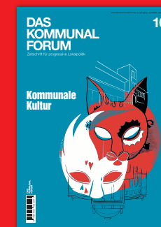
Ausgabe 10: Kommunale Kultur ISBN 978-3-945564-27-1