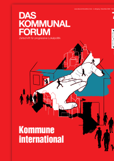
Ausgabe 7: Kommune international ISBN 978-3-945564-22-6

Diese Publikation wird mitfinanziert durch Steuermittel auf der Grundlage des von den Abgeordneten des Sächsischen Landtags beschlossenen Haushalts.