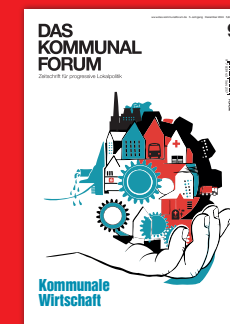
Ausgabe 9: Kommunale Wirtschaft ISBN 978-3-945564-25-7