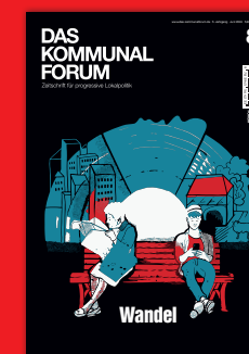
Ausgabe 8: Wandel ISBN 978-3-945564-23-3